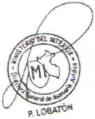
CARLOS BASOMBRIO IGLESIAS MINISTRO DEL INTERIOR