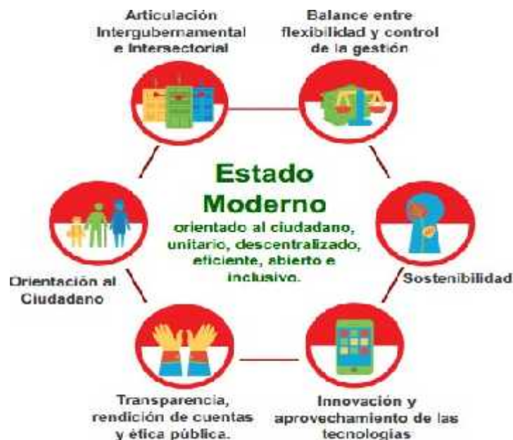
Grafico 3. Modelo de Estado Moderno

La Policía Nacional del Perú, en concordancia con la Política Nacional de Modernización de la Gestión Pública, el PESEM del Ministerio del Interior y el Plan de Modernización de la Gestión Institucional del Ministerio del Interior 2014-2016, del cual se desprende las acciones a considerar en el Plan de Modernización y de Gestión Institucional en la Policía Nacional del Perú 2015-2016; que en materia de modernización recoge y articula como objetivos del presente plan, los mismos que coadyuvarán a todo esfuerzo que emprenda el Sector Interior por alcanzar aquel Estado Moderno trazado como objetivo final por nuestro Supremo Gobierno.