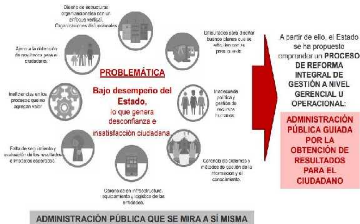
Grafico 1. Problemática de la administración pública

La Política Nacional de Modernización de la Gestión Pública al 2021 (PNMGP) tiene como objetivo emprender un proceso de reforma integral de gestión a nivel gerencial u operacional que pueda afrontar la debilidad estructural del aparato estatal y así, pasar de una administración pública que se mira a sí misma, a una guiada por la obtención de resultados para el ciudadano.